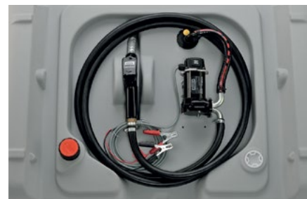
210 L cu pompă 12 V