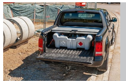
Înălțime totală 46 cm. Se potrivește sub capacul zonei de încărcare a camionetei