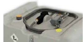
DT-Mobil Easy 440 l cu electropompă 40 l/min și pistol