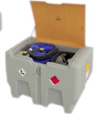
DT-Mobil Easy COMBI 440/50 l