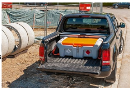
Soluția perfectă pentru transportul cu camioneta