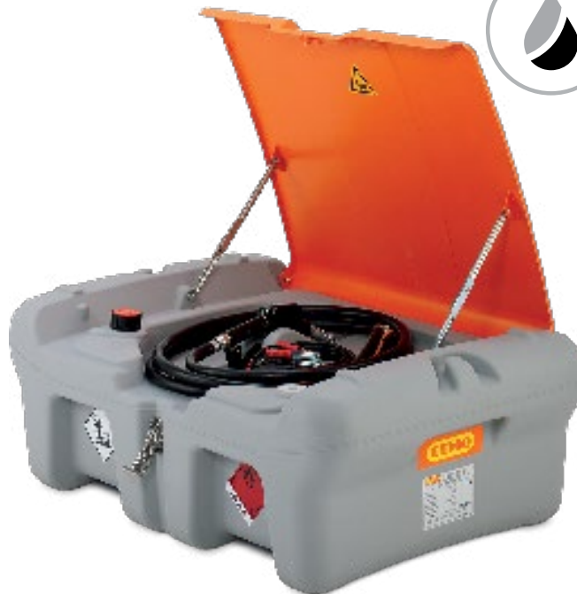
210 L cu pompă submersibilă CENTRI SP 30 și capac articulată

Rezervorul DT-MOBIL Easy pick-up 210 L este aprobat pentru transport imediat și consum sub ADR 1.1.3.1 c).