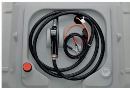
210 L cu pompă submersibilă CENTRI SP 30