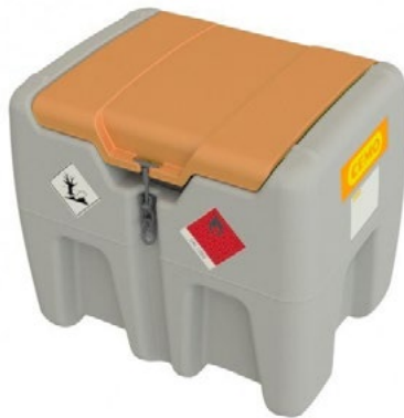
DT-Mobil Easy 210 l cu capac